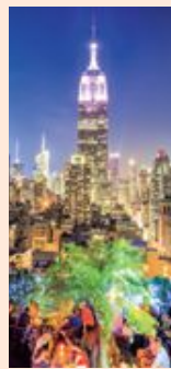
Dakterras Gansevoort Park Avenue.

→ moma.org , spicemarketnewyork.com , gansevoorthotelgroup.com