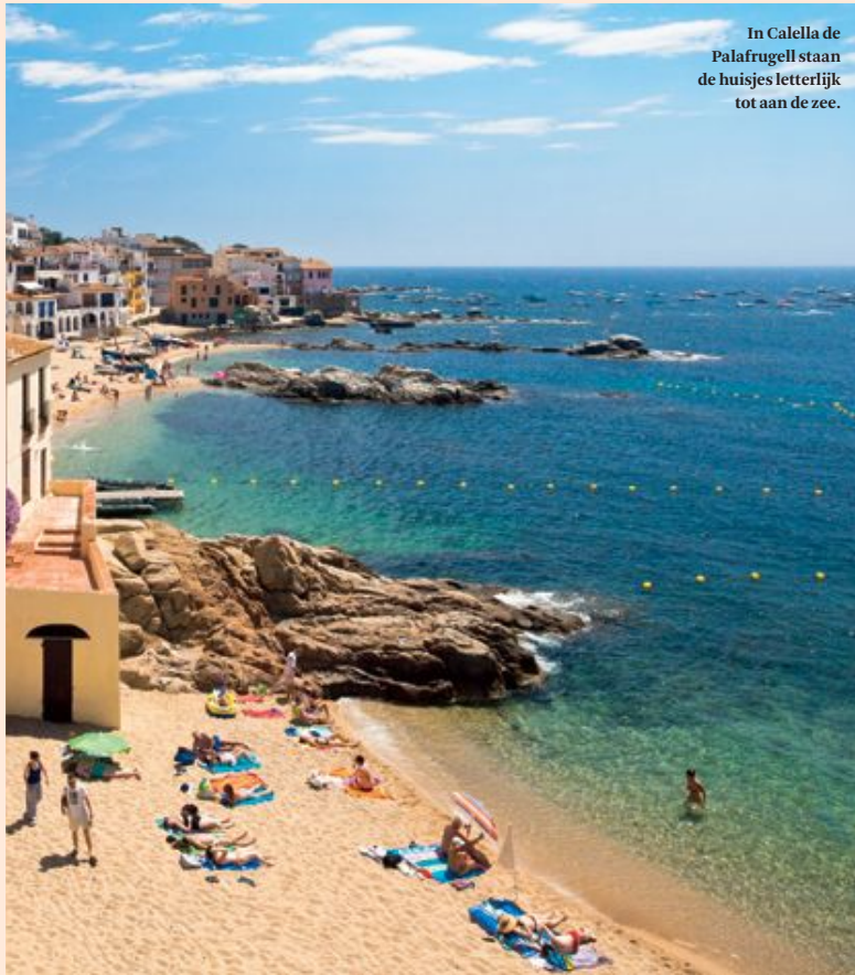
In Calella de Palafrugell staan de huisjes letterlijk tot aan de zee.