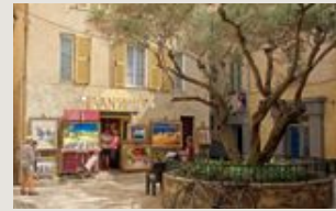
Dorpspleintje in Saint-Tropez.