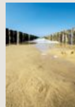
Strand van Domburg.

'Twee keer per week loop ik met een groepje vrienden hard in mijn woonplaats Zeist. Eens per jaar verruilen we onze reguliere ronde voor een parcours in het buitenland; al hardlopend beleeft u een gebied heel anders. Deze ochtend starten we in de uitgestorven haven van Saint-Tropez. We volgen de Classic route van de gelijknamige run die hier elk najaar gehouden wordt. Het is stil en zelfs nog een beetje fris. Onderweg komen we La Citadelle tegen. Deze stenen burcht beschermde de stad in de 16de eeuw.'