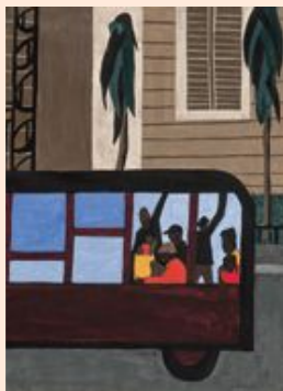
'Bus', 1941, Jacob Lawrence.

'Door deze actieve ochtend loop ik vol energie