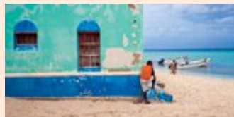
Strand van Gran Roque.

→ airbnb.com , tragamar.com , hllafranch.com , los-roques.com